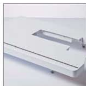
Table d'extension extra- large

Idéal pour les ouvrages de quilting. Ce cadre robuste permet à votre tissu de rester tendu et convient aux tissus lourds. Parfait pour les débutants et les passionnés.